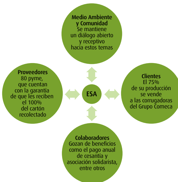
Figura 2: ESA - Principales grupos de interés